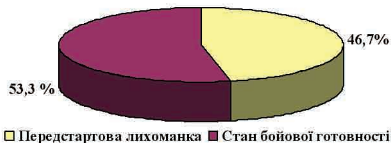
Рис. 2. Результати оцінювання власного передстартового стану учнів КГ