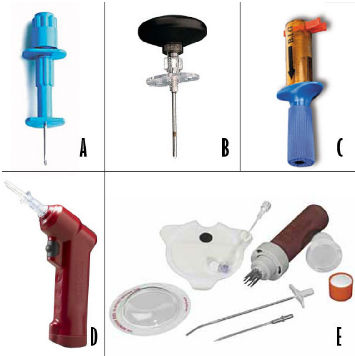
Figuur 2: (A) Jamshidi, (B) Cook, (C) Bone-Injection Gun, (D) EZ-IO, (E) F.A.S.T.1.