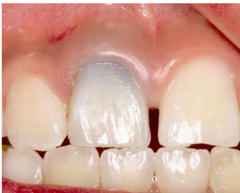
Fig. 1. Fotografia do incisivo central superior direito tratado com pasta triantibiótica, composta por ciprofloxacina, metronidazol e minociclina (KIM et al., 2010).

Outras estratégias para evitar a alteração de cor da estrutura dental têm sido estudadas, como a substituição da minociclina por outro antibiótico, ou mesmo a sua abolição da fórmula (SATO et al., 1993; DABBAGH et al., 2012).