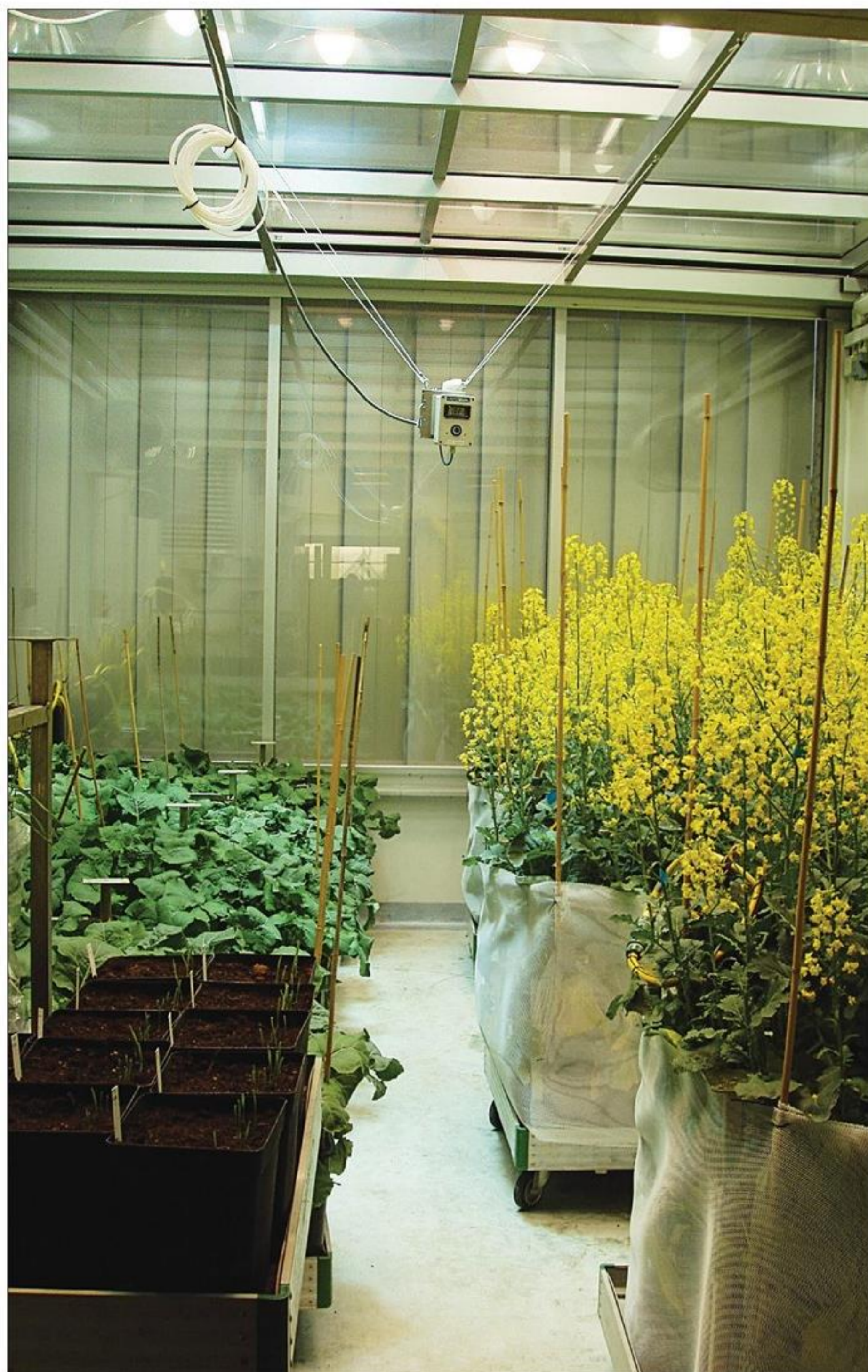
Et kig ind i et af phytotronens kamre.

med 77% pr. hektar rapsmark. Fire andre fedtsyrer i rapsolien blev ligeledes påvirket negativt, og andelen af mættede fedtsyrer blev øget på bekostning af de sundere umættede fedtsyrer.