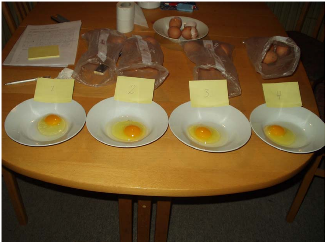
Billede 2. Blommer fra alle fire forsøgsbehandlinger.