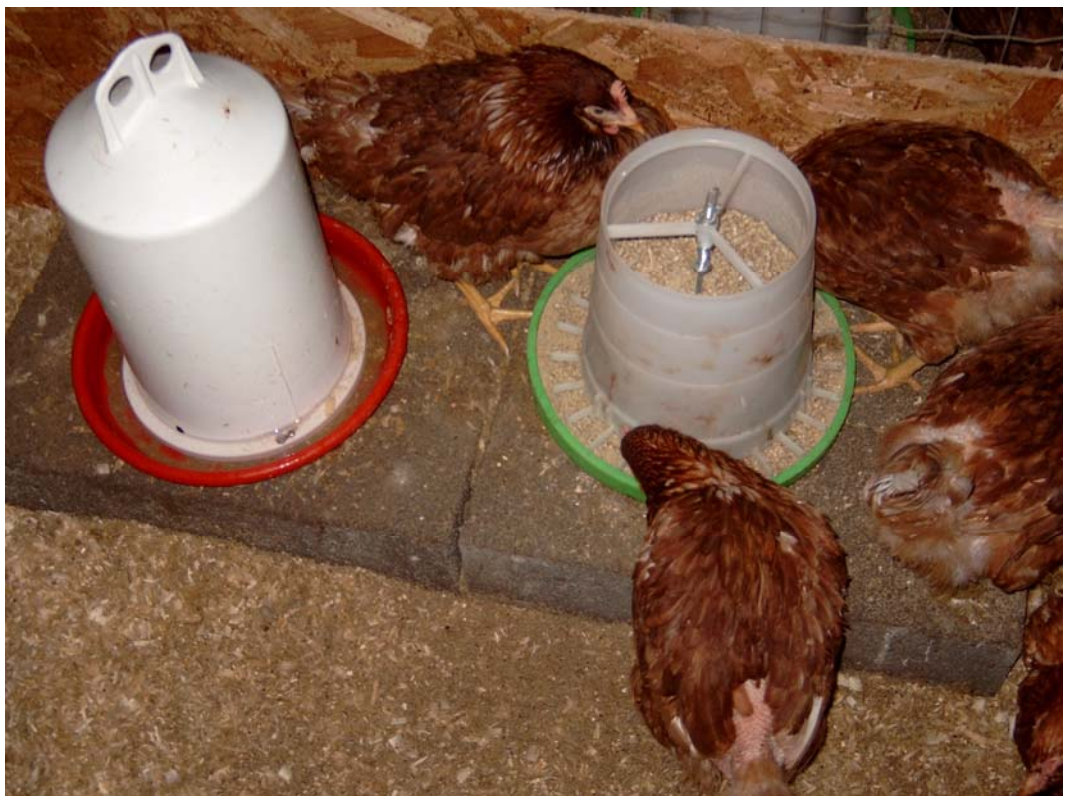
Billede 1. Foder og vandtrug.

Formålet med forsøget var at undersøge, om æglæggende høner vil æde søstjernemel, om melet bidrager til hønernes ernæring, om melet har nogle åbenbare ernæringskadelige effekter, og om søstjernemel medfører kosmetiske eller smagsmæssige problemer i konsumæg.