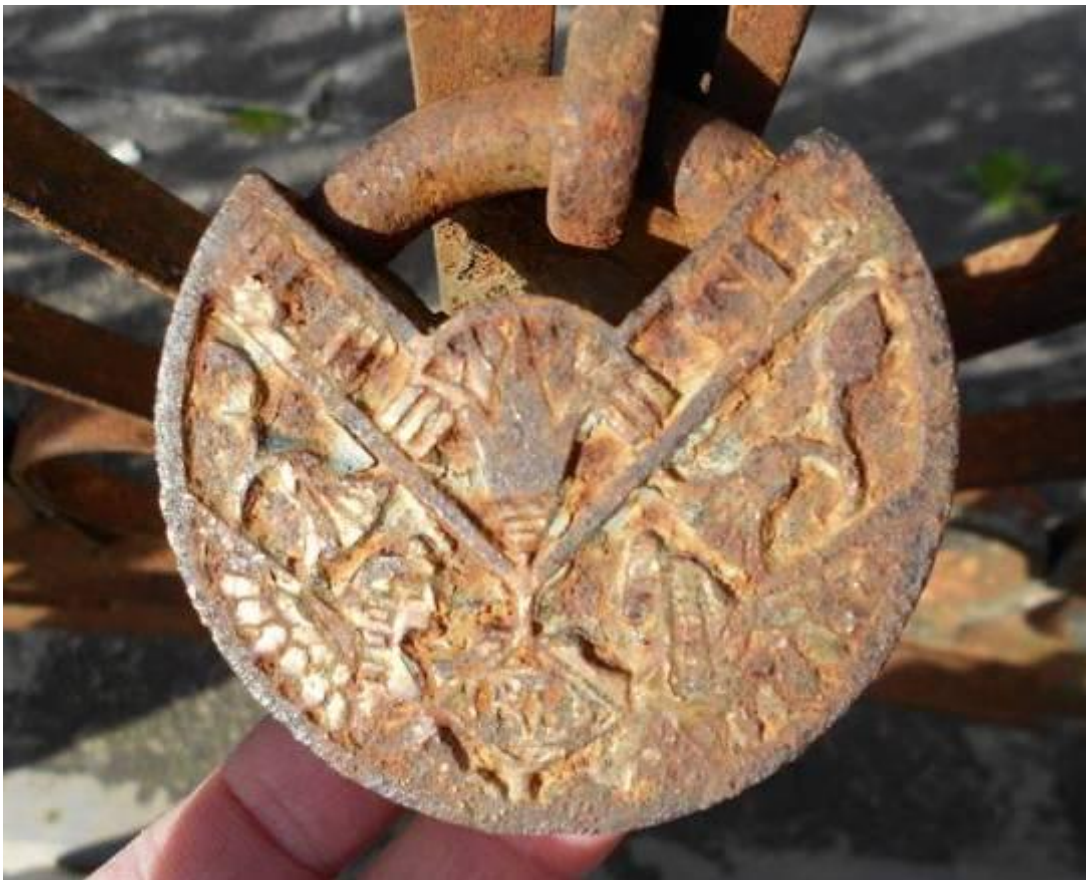
Figura 5.- Cara expuesta del candado.

En la reja de ingreso se identificó un candado acorde al estilo y el plasmado de simbología egipciaca, donde se distinguen dos esfinges aladas y enfrentadas hacia el centro de la cerradura (una femenina y otra masculina) y abundantes flores de papiro; coronando una de ellas de mayor tamaña (Fig. 5).