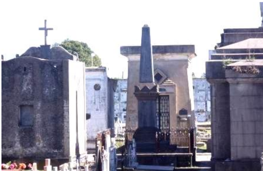
Figura 3.- Vista posterior del monumento Denot.

Por su parte, se puede constata que para la tarima se utilizaron dos plataformas superpuestas en gradas, conformando un escalonado de 40 centímetros de altura en total; la cual cumple la función de basamento de todas las unidades arquitectónicas erigidas.