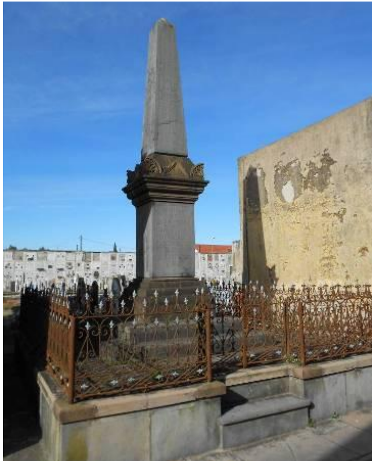
Figura 1. Vista general del monumento funerario de la familia Denot.

El monumento (Fig. 1) en estudio se ubica en la calle principal de la necrópolis local, sobre una parcela de dimensiones regulares que se adquirieron, para erigir bóvedas; el sector es conocido como de bóvedas fundacionales, por ser éste el más antiguo con esta modalidad, ya que se tiene registro de sepulturas en tierra previas a la construcción de unidades arquitectónicas funerarias (monumentos, bóvedas o mausoleos).