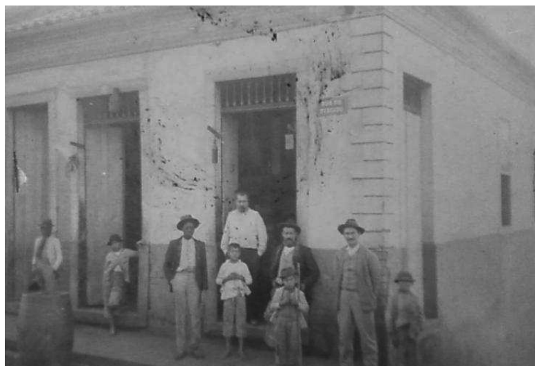
Figura 2 - O ramo de secos e molhados estava dominado por imigrantes italianos em Bragança na primeira década do século XX.