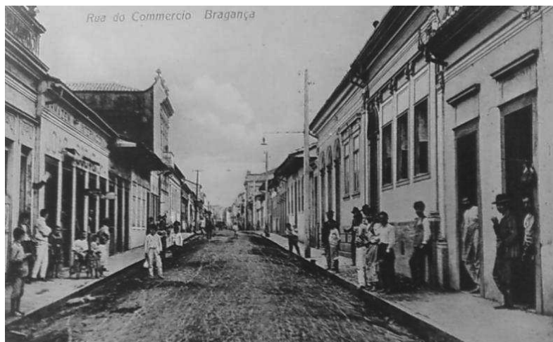
Figura 1 - Vista da Rua do Comércio em 1900, local onde se localizava o armazém dos Fontana.