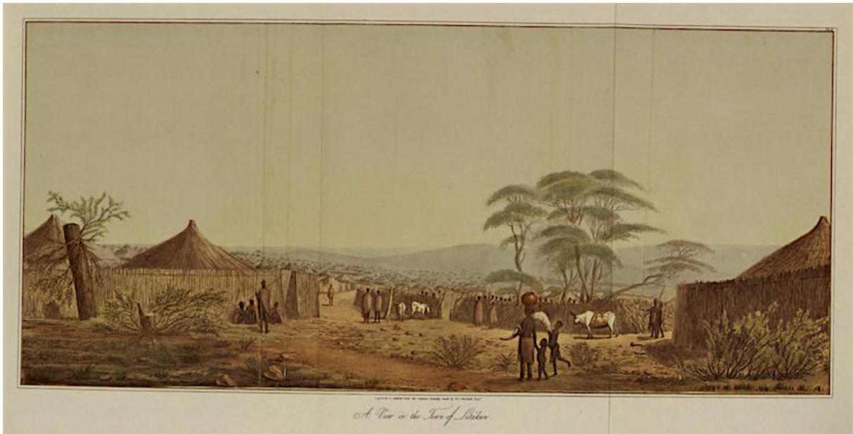
Afbeelding van Dithakong uit Burchell's Travels in the interior of Southern Africa.