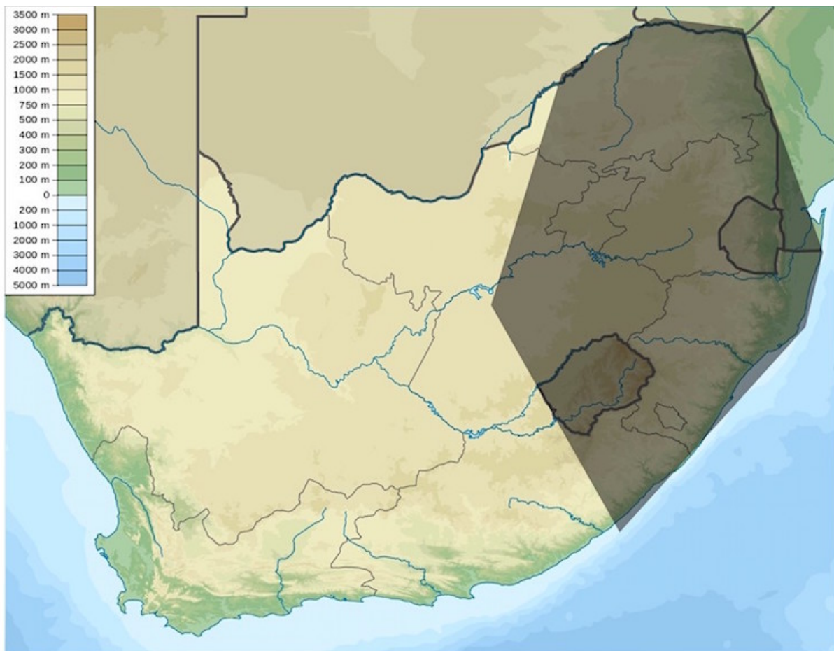
Kaart met de verspreiding van boerensamenlevingen in Zuid-Afrika rond 1600, gebaseerd op Vogel en Fuls 1999. (Kaart: Wikimedia Commons)

We kennen er nomadische jager-verzamelaars, door de kolonisten Bosjesmannen genoemd. Maar we kennen ook pastoralisten. Dat zijn veehoeders met grote kuddes schapen en runderen. Die werden door de kolonisten hottentotten genoemd. En het waren deze samenlevingen met grote kuddes vee die een belangrijke reden vormden voor de VOC om een verversingsstation in te richten bij het huidige Kaapstad. Men hoopte door handel vee voor de schepen op doortocht te verkrijgen.