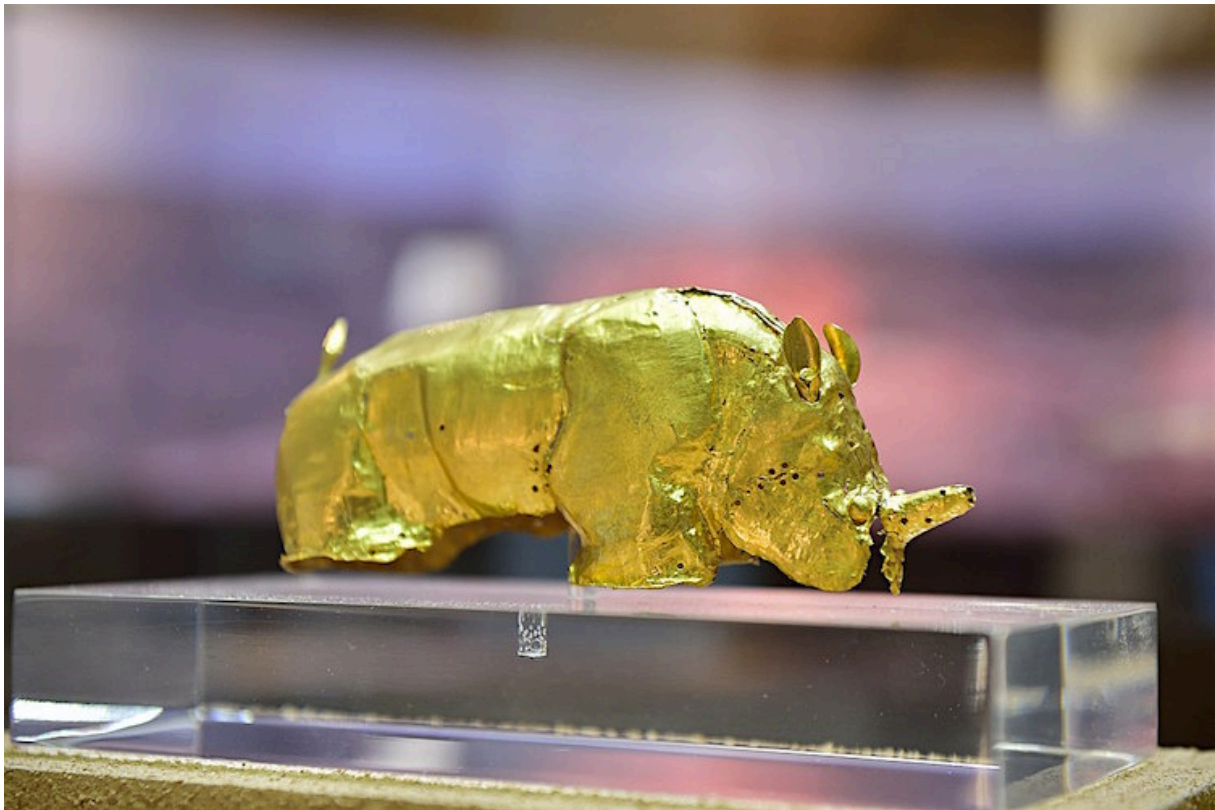
Gouden neushoorn, grafgift van een koning van Mapungubwe.

In het noorden van Zuid-Afrika ontstonden al vanaf de elfde eeuw echte staten waarin een elite de controle over grote gebieden uitoefende. De vroegste van die koninkrijken, Mapungubwe (1075-1220), had een hoofdstad net ten zuiden van de Limpoporivier. Haar gebied spreidde zich uit over delen van het noorden van Zuid-Afrika, het zuiden van Zimbabwe en het oosten van Botswana. De rijkdom van de elite blijkt wel uit hun kostbare grafgraven die archeologen ontdekten.