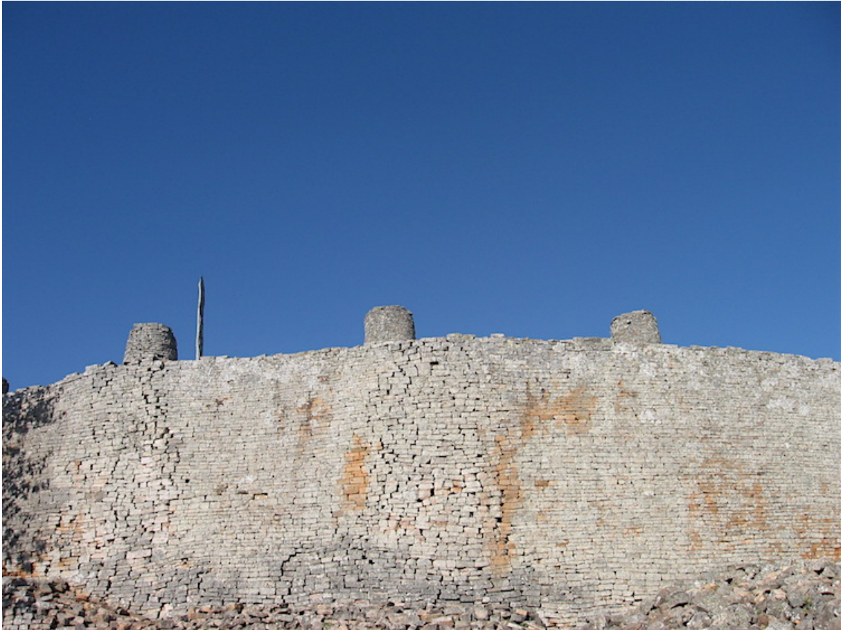
Great Zimbabwe muur van het Hill Complex, het oudste deel van de stad. 9e – 13e eeuw.