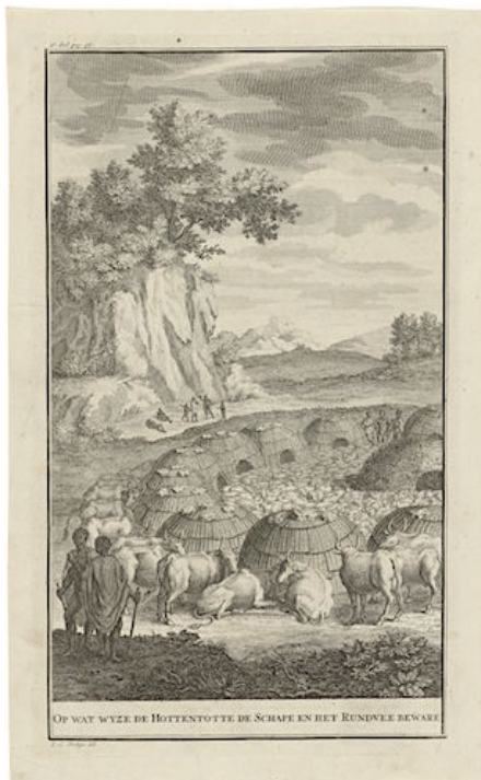
Kraal van de Khoi met kudde vee. (Jan Caspar Phillips 1727)