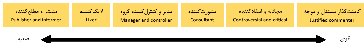
نمودار ۱: طیف بازخوردهای معلمان در شبکه‌های اجتماعی براساس میزان تعامل Fig. 1: The range of teachers' feedback on social networks based on the amount of interaction

سطح اول) منتشر و مطلع کننده: تعدادی از معلمان مشارکت‌کننده در مصاحبه‌ها به اشتراک‌گذاری اطلاعات در شبکه‌های اجتماعی علاقه‌مند هستند. این سطح از مشارکت در واقع ضعیف‌ترین سطح تعامل را ایجاد می‌کند و کاربر، مطالب را بدون مطالعه یا با مرور اجمالی در بین دیگر کاربران منتشر می‌سازد. این‌گونه افراد نقش مستقیم در ایجاد مطالب و محتوا ندارند و ماحصل تلاش‌های علمی یا تجربه‌های دیگران را منتشر کرده و در اختیار سایر کاربران در شبکه‌های اجتماعی قرار می‌دهند. این دسته از معلمان باز نشر و انتشار محتوا در این شبکه‌های اجتماعی را بسیار هدفمندتر از دیگر رویکردها مدنظر قرار می‌دهند که شاید با استفاده‌های سرگرمی و جنبه‌های شخصی و جانبی حضور در شبکه‌های اجتماعی مجازی همخوانی کمتری داشته باشد. انگیزه این دسته از معلمان در این فعالیت به‌منظور یکسان‌سازی محتوای منتشر شده می‌باشد؛ چرا که وقتی محتوایی دست‌خوش تحریف گردد و در شبکه‌های اجتماعی نشر پیدا کند، با شایعات همراه می‌شود. همچنین علاقه‌مند به آگاه‌سازی معلمان در جهت بهبود عملکرد آنان در حیطه آموزشی، مساعدت و هدایت آنان می‌باشد. لازم به ذکر است که اکثر مشارکت‌کنندگان اظهارات مشابهی داشتند. مصاحبه‌شونده کد ۷ در این خصوص می‌گوید: