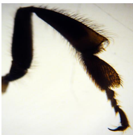
Figura 2: Perna coletora de uma abelha Jandaíra, apresentando corbícula livre de carga de pólen ou outros subprodutos.

Pôde-se observar, ainda, que as abelhas apresentaram um peso médio de 0,0520g, variando de 0,0399g e 0,0621g. Como não houve seleção de abelhas operárias de acordo com as atividades desenvolvidas na colônia, esta variação, provavelmente, pode ter sido em função do conteúdo estomacal e a carga de pólen. Aquino (2006) descreve estas abelhas com, em média, um peso de até 0,04720g.