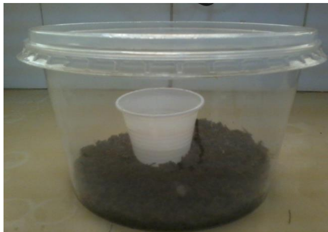
Figura 1 – Unidade experimental para medição da atividade microbiana.