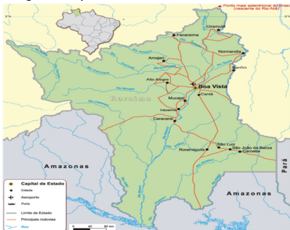
Figura 1 – Mapa de Roraima e seus limites territoriais