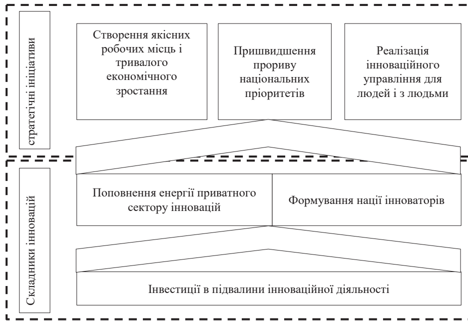
Рис. 2. Пріоритети інноваційної стратегії США 2015 року Складено за: [8]