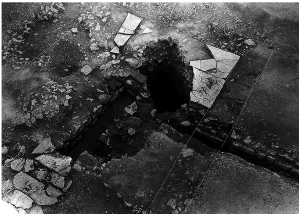
Fig. n°3 : « Macellum » : Bassin central (vue du sud-ouest) avec système d'adduction et d'évacuation des eaux

Auteur(s) : Paillet, Jean-Louis. Crédits : GI 1997 ; CNRS Éditions 1998 (1989)