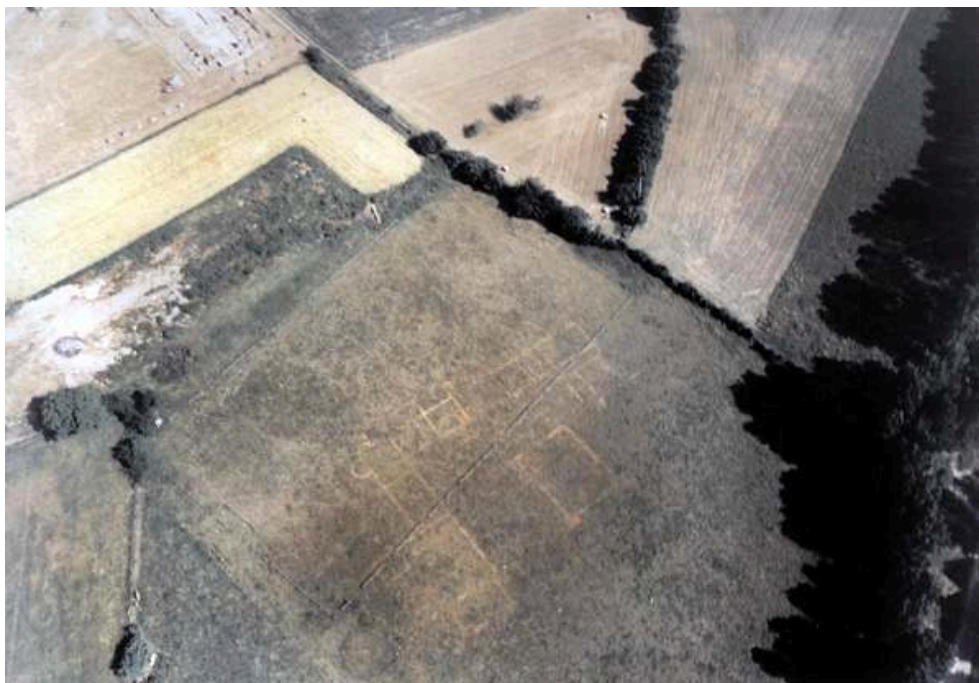
Fig. n°2 : Vue d'ensemble avec en haut et à droite le macellum

Auteur(s) : Pradalié, Georges. Crédits : GI 1997 ; CNRS Éditions 1998 (1989)