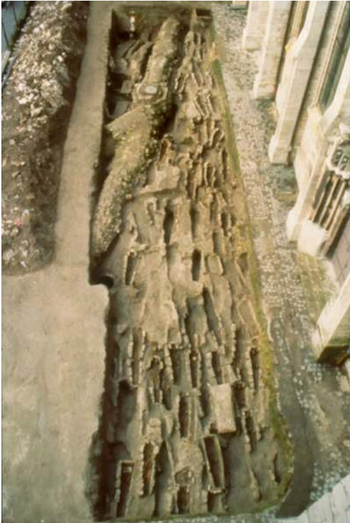
Auteur(s) : Le Maho, Jacques. Crédits : ADLFI - Le Maho, Jacques (2003)