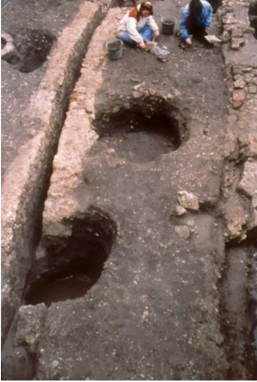
Auteur(s) : Le Maho, Jacques.