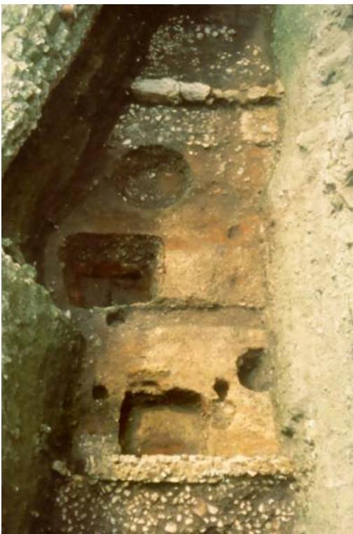
Fig. n°2 : Sols et structures du IV e s.

Auteur(s) : Le Maho, Jacques.