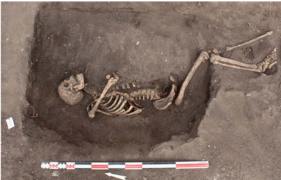
Fig. 2 – Sépulture 1055

Topographie : M. Seguin (Inrap) ; DAO : C. Ranché (Inrap).