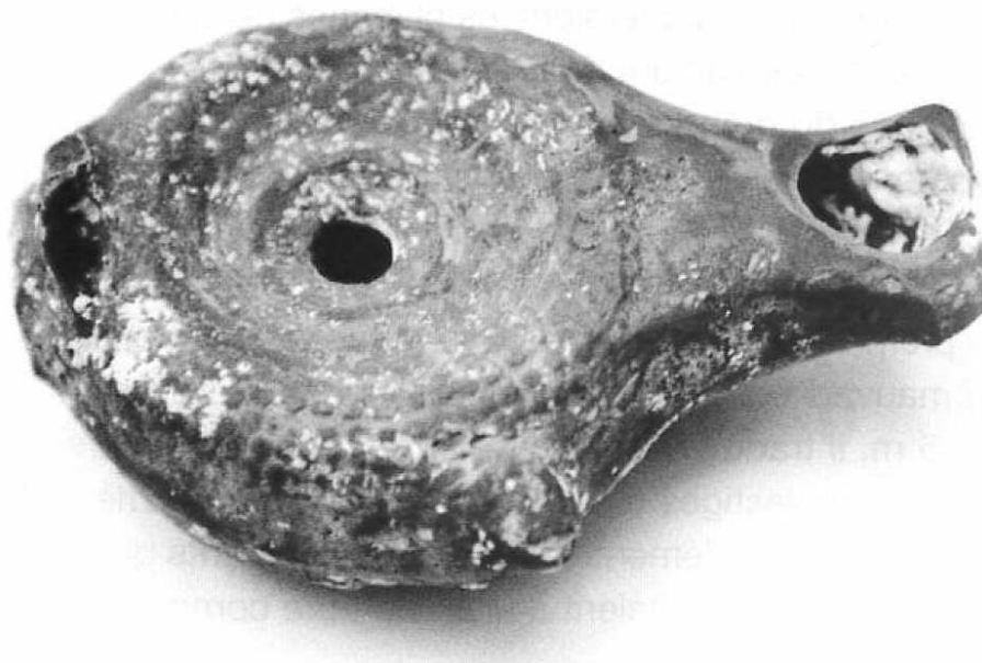
Fig. 2 – Lampe à huile