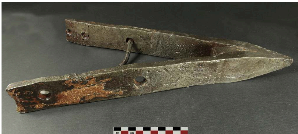
Fig. 2 – Sabot de pieu