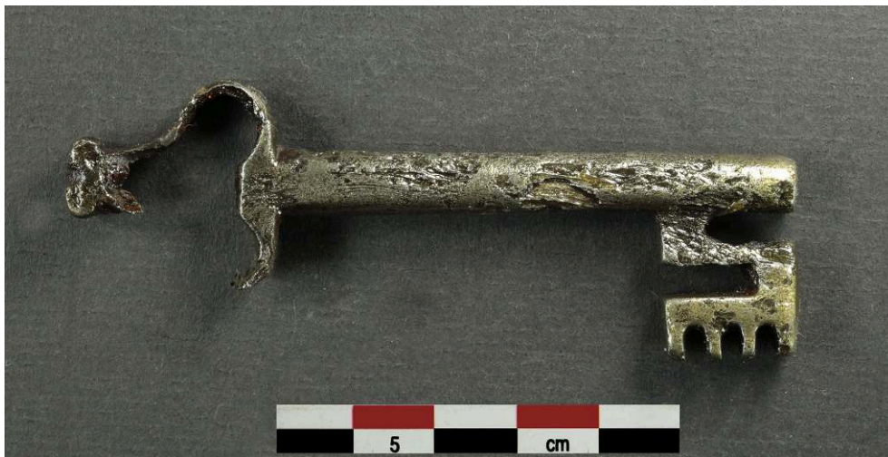
Fig. 2 – Clé (XVII e s.)