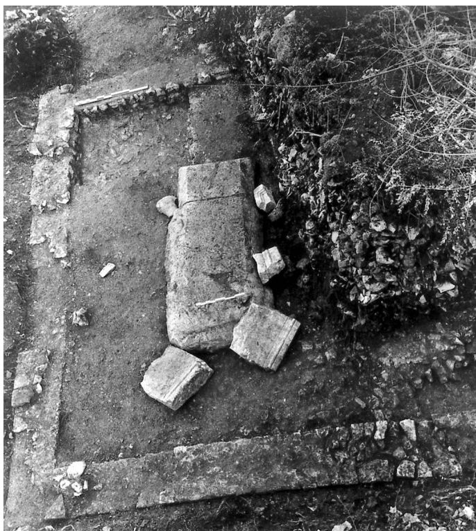
Fig. 2 – Cella nord du sanctuaire avec le socle du monument en place