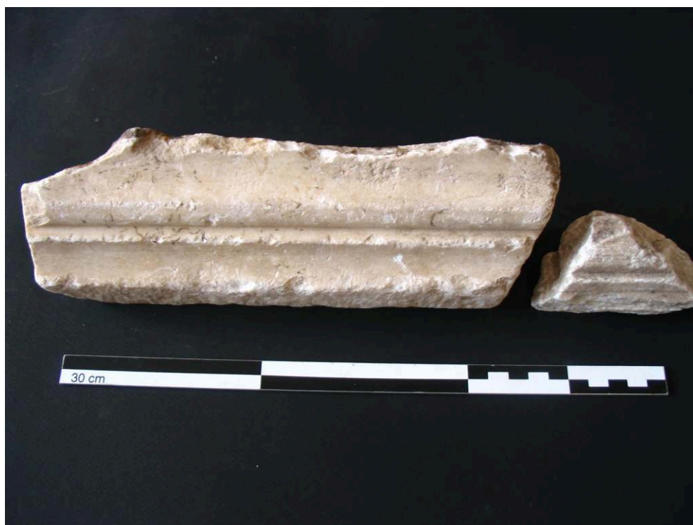
Fig. 1 – Fragments de corniche en marbre