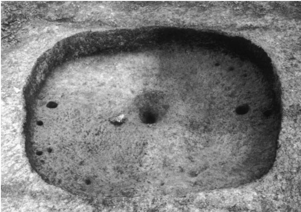
Fig. 2 – « Les Graviers » : fond de cabane à trois poteaux axiaux