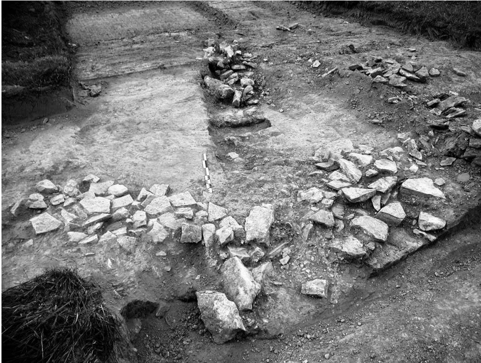
Fig. 1 – Vue de la dépression comblée