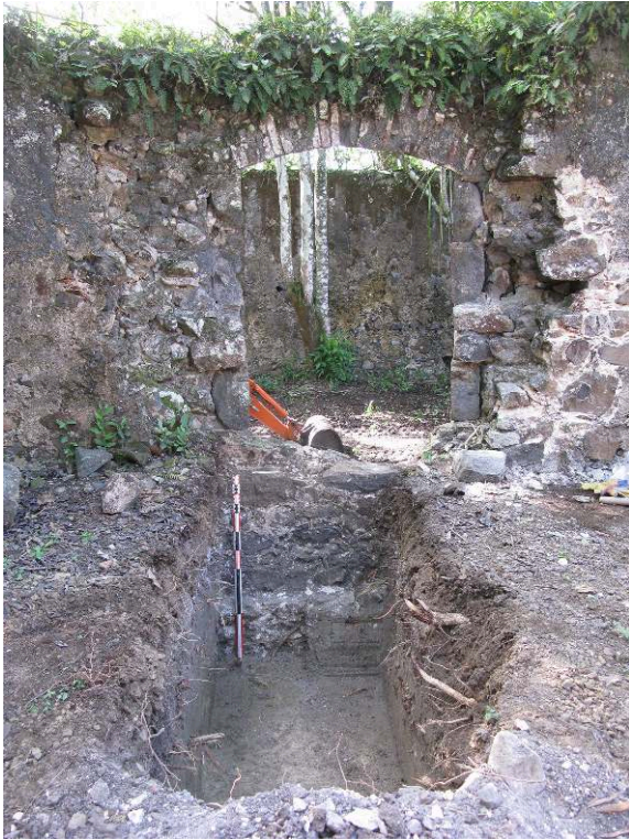
Fig. 2 – Observation des maçonneries et des niveaux associés