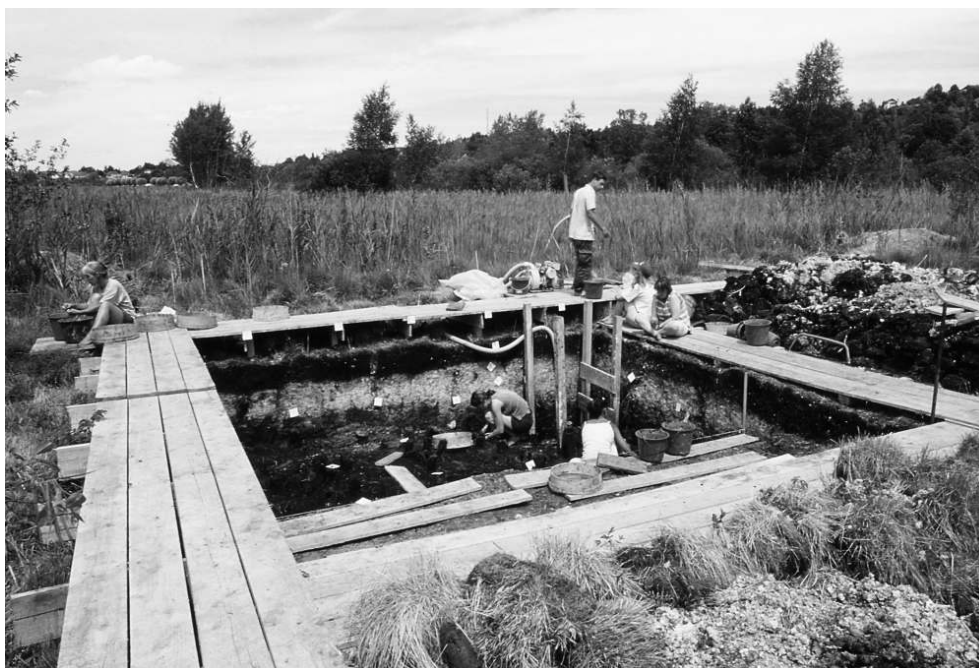
Fig. 1 – Vue générale de la fouille de Clairvaux XIV, avec pompage à l'intérieur d'un caisson