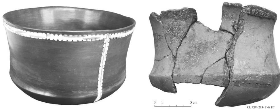
Fig. 3 – Clairvaux XIV : gobelet caréné avec décor à l'écorce de bouleau découpée et collée