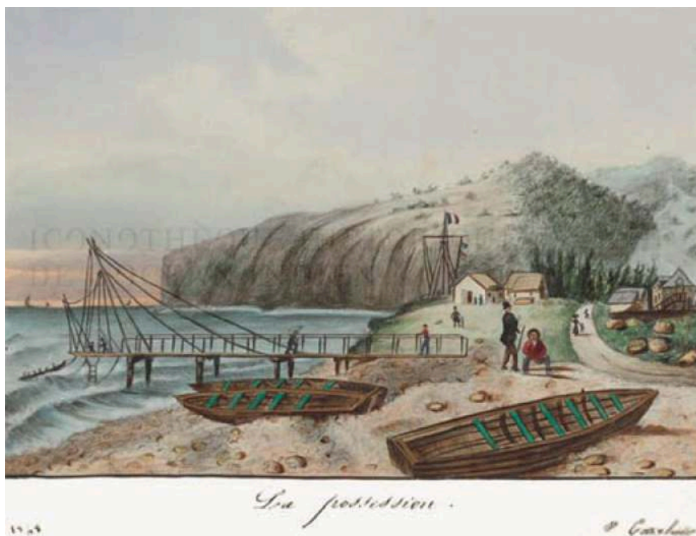
Fig. 1 – La Possession, aquarelle de Caroline Viard (juin 1848)