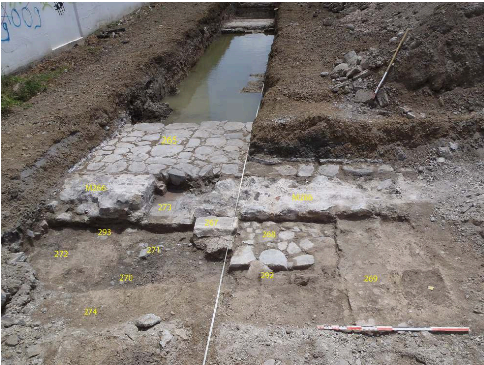
Fig. 2 – Vue vers le nord de l'extrémité sud de la tranchée 2