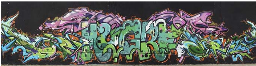
Figura 7. Mugre Diamante (2014).

Se as cidades, retomando a Calvino, sempre se tomaram como femininas e por isso enquanto objetos de desejo e de conquista, a escrita de graffiti por parte das mulheres, seu gesto, operaria uma reapropriação dessa perspectiva do feminino, dessa restrição prática, artística e política que, desde a diferença sexual e da linguagem, supõe um papel secundário ou estreitamente vinculado ao discurso sobre a feminilidade nas intervenções das grafiteiras. A potência da visibilidade das mulheres na cidade a partir da prática do graffiti mais ilegível, a tag , não só mostra estratégias de reconquista da cidade e sua paisagem, mas um reposicionamento estratégico sobre o imaginário urbano escrito com nome de mulher: as cidades contemporâneas também são feitas de seus gestos sem fim.