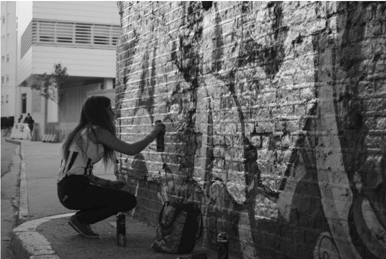
Figura 5. Mickey (2014).

No procedimento e não tanto no produto, então, estaria a condição de legibilidade das tags , uma espécie de escrita na qual não se coloca nada além do nome, mas que partindo disso e sem se preocupar com qualquer intenção literária, definiria o oposto, o diferente, o despreocupado num sentido de desapego institucional, de qualquer tipo de significado diáfano e reconhecível para quem as lê, inseridas dentro de uma linguagem que se assume homogênea. Essa indefinição do sentido da prática e de sua ambiguidade intrínseca, contudo, não resolve o fato de sua incompreensão generalizada, um aspecto que, entre as/os escritoras/ es de graffiti define seu espírito e reafirma seu caráter: no graffiti, a compreensão não depende da escrita, senão que se efetiva nas suas possíveis leituras.