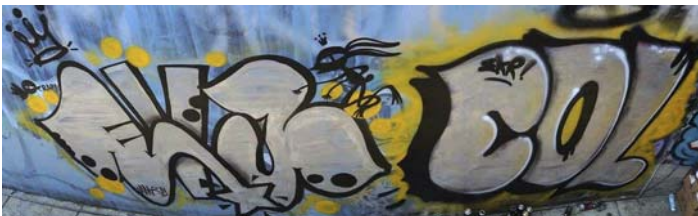
Figura 2. Eva Bracamontes (2015).

A presença de graffiti nas cidades implica, paralelamente, reconhecer a existência de domínios diferenciados de linguagem e enunciação, ou seja, de práticas expressivas que se apropriam de algumas características da escrita formal para se distanciar dela, para desafiar e contestar sua imposição (Rama, 1998). No graffiti, entendido neste texto na sua acepção primária de assinar distintos suportes com um pseudônimo ou apelido (o que no vocabulário desse fenômeno urbano se reconhece como fazer uma tag , aproximando esse uso às origens do movimento hip-hop estadunidense da década de 1970), tem lugar uma forma de escrita que dá origem a uma língua política, o que, de acordo com Claudia Kozak (2004, p. 97), “permite a leitura assombrada diante do habitual adormecimento dos sentidos urbanos”.