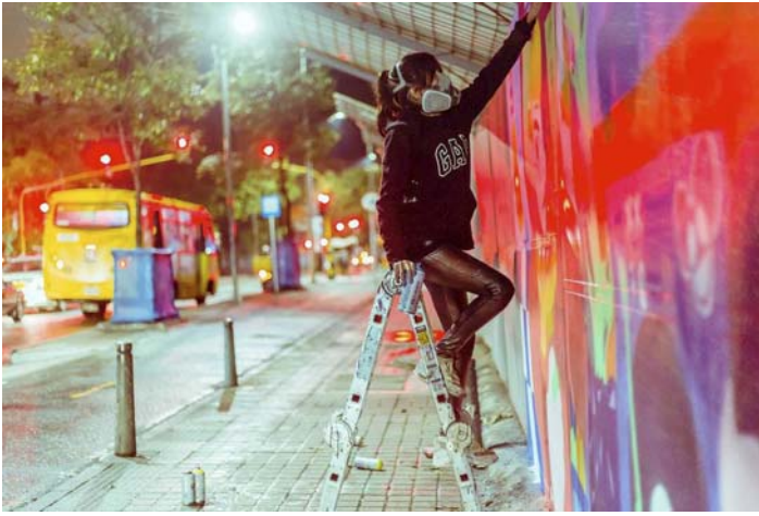
Figura 1. Mugre Diamante (2017).

A presença de graffiti nas cidades implica, paralelamente, reconhecer a existência de domínios diferenciados de linguagem e enunciação, ou seja, de práticas expressivas que se apropriam de algumas características da escrita formal para se distanciar dela, para desafiar e contestar sua imposição (Rama, 1998). No graffiti, entendido neste texto na sua acepção primária de assinar distintos suportes com um pseudônimo ou apelido (o que no vocabulário desse fenômeno urbano se reconhece como fazer uma tag , aproximando esse uso às origens do movimento hip-hop estadunidense da década de 1970), tem lugar uma forma de escrita que dá origem a uma língua política, o que, de acordo com Claudia Kozak (2004, p. 97), “permite a leitura assombrada diante do habitual adormecimento dos sentidos urbanos”.