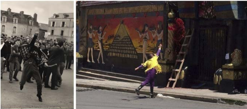
Figura 3. À esquerda: Manifestation paysanne à Redon (1967), Gilles Caron (Simon, 2016); à direita: Mujeres Creando , ação na casa noturna Katanas , La Paz (Mujeres..., 2016).

Precisamente, as questões do gesto e do desejo são colocadas por Georges Didi-Huberman como condição de possibilidade dos levantes, tema de sua última curadoria para a exposição itinerante que teve o mesmo nome 6 e na qual se ocupou das imagens das insurreições contemporâneas. Fundamentado no conceito freudiano de impulso de liberdade ( Freiheitsdrang ), Didi-Huberman entende ali o desejo como “gesto sem fim ”, pulsão de vida e de liberdade, um acoetimento em que as palavras exclamadas completam o gesto insurreto, por minúsculo que seja, constituindo uma ação de soberania em face da opressão, daquilo que submete os sujeitos e condiciona e cancela seus desejos, e que no âmbito das cidades corresponde a um dispositivo de regulamentações e proibições operantes sobretudo na sua paisagem. O suporte no qual as tags aparecem, configurando outras formas de exclamação da palavra pela via da visibilização da escrita, então, será mais do que relevante para compreender a encenação dos desejos no espaço público, suas distintas formas, agentes e formatos.