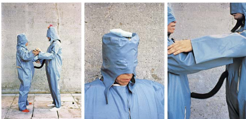
Figura 6. O eu e o tu: Roupa-corpo-roupa (1967), Lygia Clark (Hammer Museum, 2018).

a reformulação de valores estéticos possibilitada por um grupo considerável de artistas ainda existe o preconceito que assume que as artistas mulheres não são tão boas quanto os homens artistas? Ainda que dita passagem tenha acompanhado os desdobramentos dos feminismos e suas distintas lutas, frentes e conquistas, processos de invisibilidade vinculados ao sexismo dentro da arte se mantiveram sobre as artistas tanto nos museus quanto no espaço público. 11 E, mesmo que, como salienta Cecilia Fajardo-Hill (2018, p. 21), “o posicionamento contra a ordem estabelecida, o experimentalismo, a originalidade e o não conformismo” sejam qualidades celebradas nas práticas estéticas no século XXI – expressas de forma contundente em práticas como o graffiti – uma enorme suspeita é levantada sobre o trabalho das mulheres artistas, pois a qualidade e a visibilidade de suas obras e intervenções são condicionadas ao sucesso.