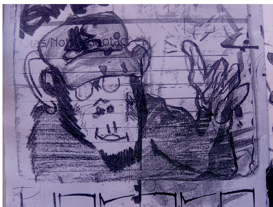
Figura 13 ▶ O primeiro macaco desenhado por Gorga em papel no início dos anos 2000. Mais tarde o artista viria a reproduzir o desenho nos muros da cidade

Gorga e a produção de Macacos Urbanos são um bom exemplo para pensarmos nas relações entre arte e cidade, e, mais que isso, humanizá-las. Refletir sobre o gesto é reconhecer um fluxo de vida presente nas cores das metrópoles. Quando o artista encara o muro como mais uma dimensão possível do seu trabalho, lidando com a fronteira entre privado e público, legal e ilegal, há um saber técnico, político e gestual ali integrado.