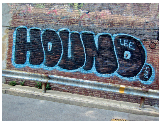
Figura 9 ▶ Um exemplo de throw up clássico, feito rapidamente e com pouca variabilidade de tintas, na cidade de Nova Iorque

As consequências gestuais destes novos artefatos que chegaram à cena da arte urbana implicaram, em maior ou menor grau, um distanciamento de uma estética inicial do graffiti como as expressões do “ throw up ” e do “ bomb ”. Esse desvio não acarreta uma ruptura com o graffiti tradicional, principalmente o de referência nova-iorquina, mas sim continuidades e descontinuidades advindas de um avanço tecnológico das ferramentas técnicas de produção de arte urbana. Nota-se uma massiva produção de personagens urbanos feitos com a precisão técnica que as ferramentas modernas permitem; entretanto, isso não elimina a duração e a permanência de produções de intervenções clássicas do graffiti 10 .