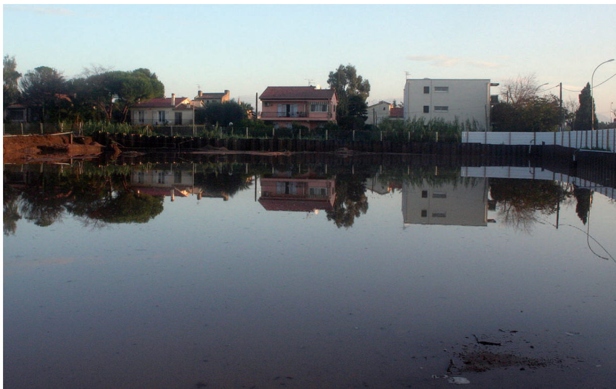
Vue du chantier après les inondations de décembre 2006.

L'ensemble des études archéologiques et paléoenvironnementales a été intégré dans le corps du développement en suivant les phases chronologiques. Une partie de ces études est présentée de façon plus détaillée dans la deuxième partie : analyses et études. Afin de ne pas surcharger le développement, les inventaires ont été condensés, ainsi que le listing de l'ensemble des unités stratigraphiques et la grande coupe nord-sud, à laquelle fait référence le phasage d'ensemble, sont présentés intégralement dans la troisième partie : bibliographie et inventaires.