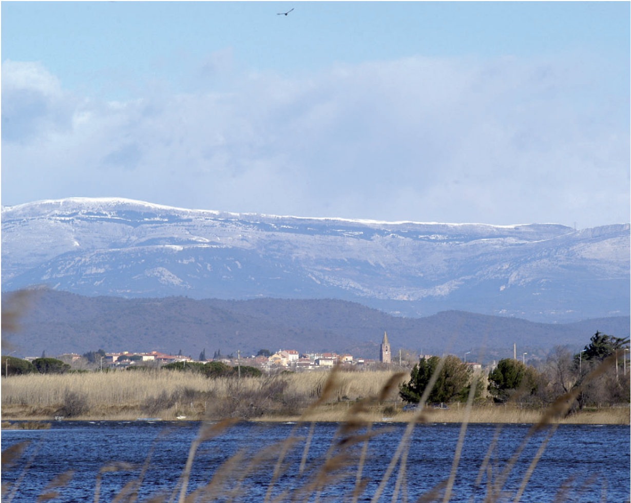
Vue de Fréjus depuis les étangs de Villepey avec, en arrière plan, les sommets enneigés du plateau de Canjuers.