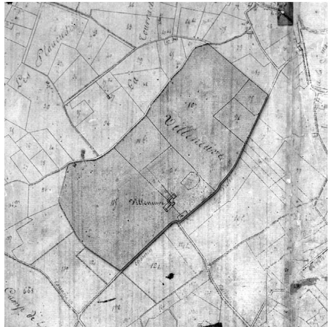
Fig. 233. Détail du cadastre napoléonien de 1826.

Le mobilier subactuel est rare. On compte quatre bords d'objets en porcelaine mécanique renvoyant au plus tôt au XIX e siècle ou au début du XX e siècle. De façon anecdotique, on soulignera encore la présence de deux témoins d'une fréquentation du site au Moyen Âge. Il s'agit d'un bord de marmite à pâte grise grésée et d'un bord de marmite à glaçure interne jaune de l'Uzège (fig. 234 - n o 18). Ce dernier est daté des XIV e et XV e siècles (Amouric et al. 1995, fig. 102-103, 107).