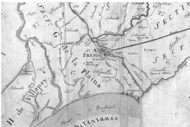
Fig. 232. Extrait du cadastre napoléonien de 1826.

Cette dernière phase, qui va de la fin du XVII e siècle à nos jours, n'a été que partiellement abordée. Le secteur est toujours resté une zone agricole jusqu'à la construction actuelle. La fructiculture est restée prépondérante durant le XX e siècle, où ce sont des pruniers qui ont succédé aux vignes, après l'inondation du terrain causé par la rupture du barrage du Malpasset.