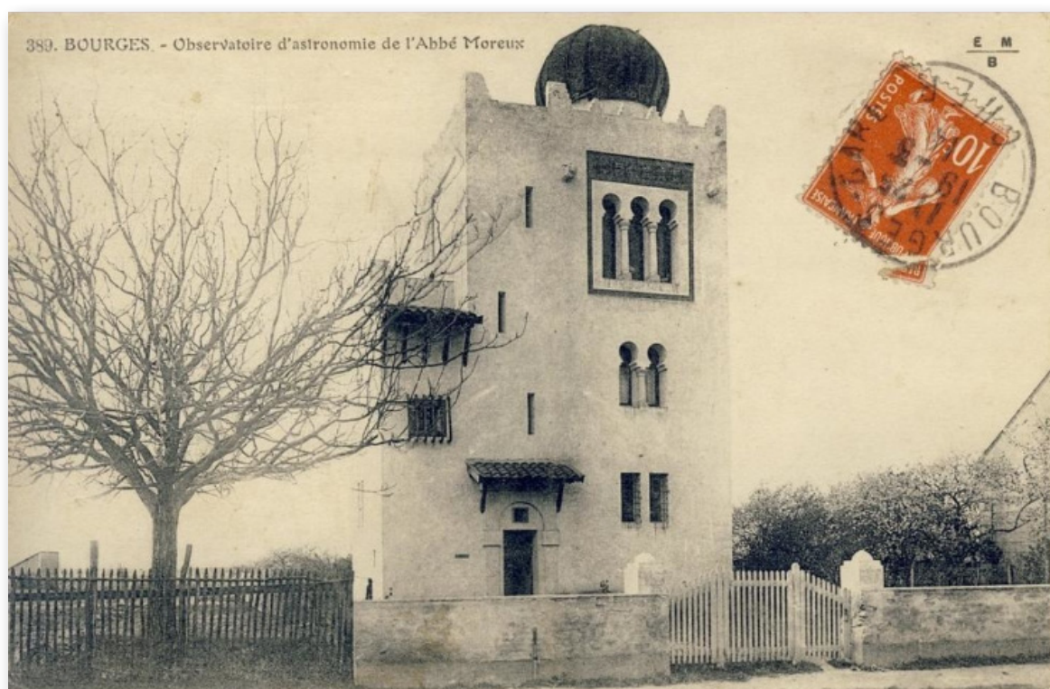
Illustration 3. L'observatoire de l'abbé Moreux 6 .

« Cela ne m'empêche pas d'ailleurs de m'occuper de mes étoiles et de mes planètes et, grâce à l'observatoire de l'abbé Moreux, j'ai pu observer le passage de Mercure sur le Soleil : les calculs logarithmiques de la station ont été faits par moi ; bien entendu l'abbé Moreux est devenu mon ami et nous passons de très agréables soirées en contemplant les merveilles du ciel. » 5 (voir l'illustration 3).