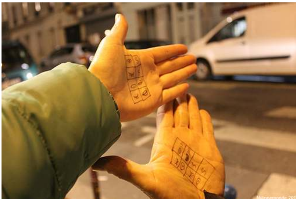
Photographie des partitions de l'expérimentretien de Belleville. É. Olmedo, 2013