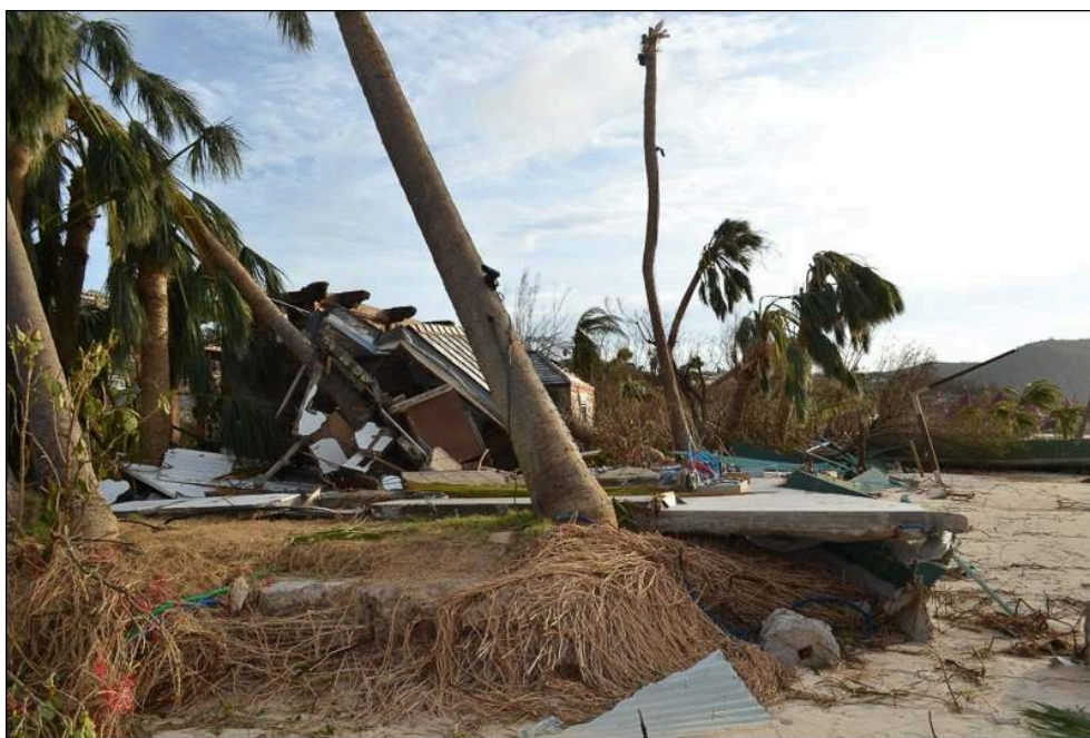
Illustration 1a - Ruine d'une construction en première ligne du littoral suite au passage d'Irma dans la baie de Saint-Jean (Saint-Martin)