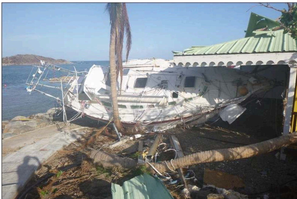
Illustration 1b - Habitation détruite par l'échouage d'un bateau au passage d'Irma à Cul-de-Sac (Saint-Martin)