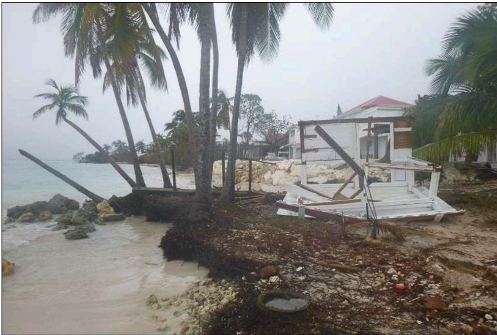
Illustration 2b - Bungalow en ruine à Grand-Bourg (Guadeloupe) suite au passage de Maria