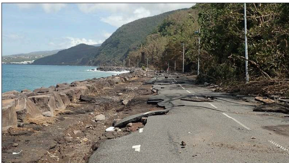
Illustration 2a - Endommagement de la route littorale entre Vieux Fort et Basse-Terre (Guadeloupe) suite au passage de Maria