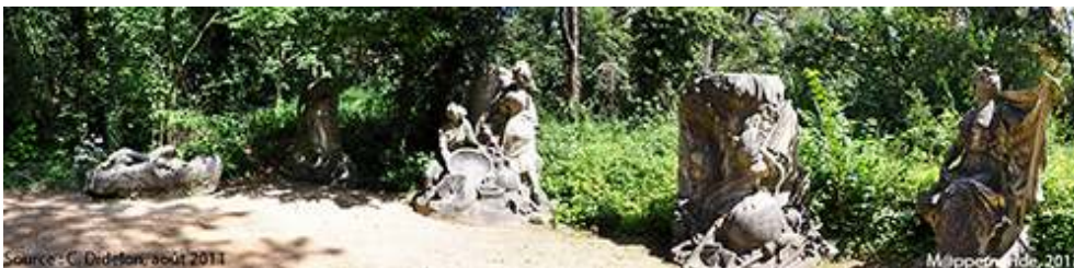
Photographie 1. Ensemble de statues