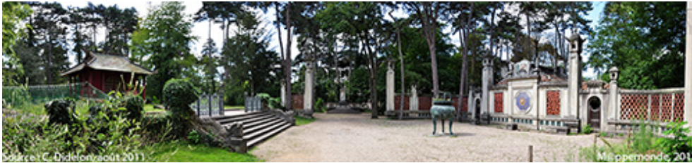
Photographie 2. Esplanade du Dinh

les arbres à deux fois, pour nous assurer que nous sommes bien à Paris et que nous n'avons pas été transportés sans nous en rendre compte dans la jungle d'une contrée lointaine. Mais, déjà, voici d'autres surprises. Après avoir traversé un petit pont khmer, nous voici sur une vaste place où, face aux ruines d'un portique vietnamien, se dresse une pagode rouge vif, apparemment récente, au milieu d'une pelouse bien entretenue. Entre les deux, une grande urne funéraire. Nous sommes sur l'esplanade du Dinh ( photographie 2 ) ; nous sommes au jardin tropical de Paris.