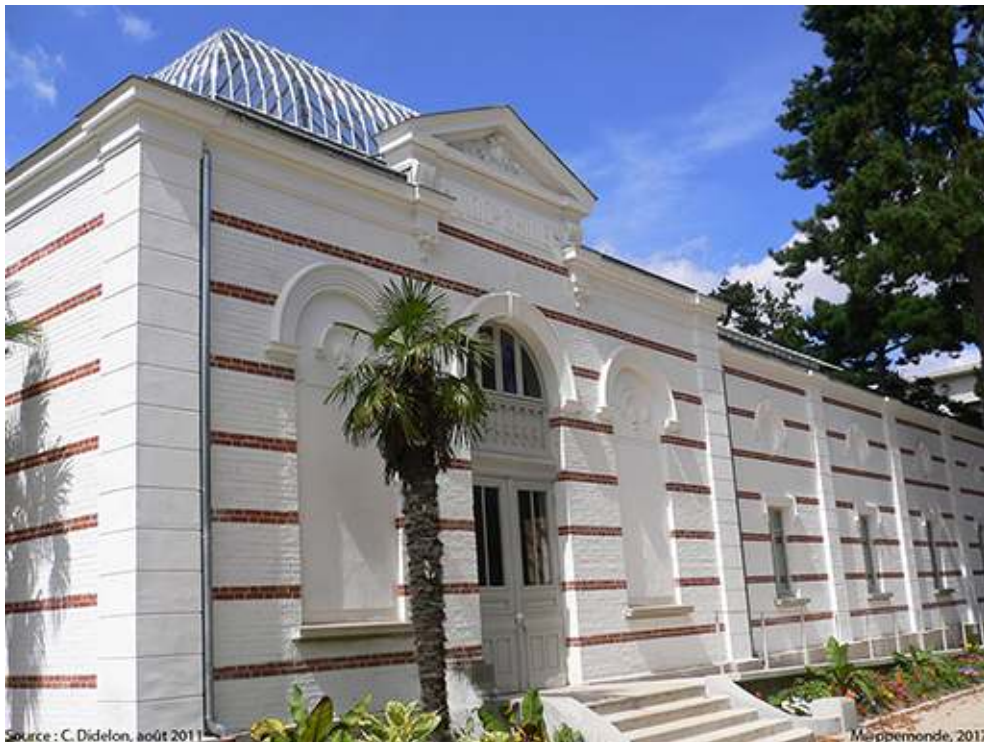
Photographie 4. Pavillon d'Indochine

( photographie 4 ). D'autres, comme le pavillon du Maroc ( photographie 5 ), insalubres et dangereux, sont entourés de barrières et de rubans de travaux pour en interdire l'accès. D'autres ont été brûlés récemment dans des incendies criminels comme celui du Congo, dont il ne reste guère que quelques poutres sinistres s'élevant vers le ciel ( photographie 6 ). Cela a également été le cas de la pagode de l'esplanade du Dinh, brûlée en 1984 après un pillage en règle et remplacée par la pagode actuelle, plus modeste 5 . Le pavillon de la Tunisie ( photographie 7 ), agrandi et percé de fenêtres, a quant à lui servi de laboratoire de physique quand le site accueillait encore les chercheurs. Aujourd'hui, il est à nouveau désaffecté et ses encadrements de fenêtres accueillent en août 2011 d'étranges sculptures dont on pouvait se demander s'il s'agissait d'art ou simplement d'états dessinant un motif complexe. La serre du Dahomey est couverte d'une bâche bleue ; le pavillon de la Réunion d'une bâche transparente. Tous deux doivent faire face aux assauts de la végétation locale.