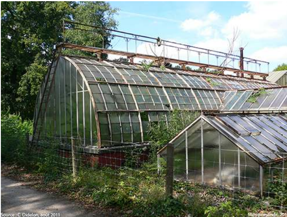
Photographie 3. Grande serre du jardin d'essai tropical