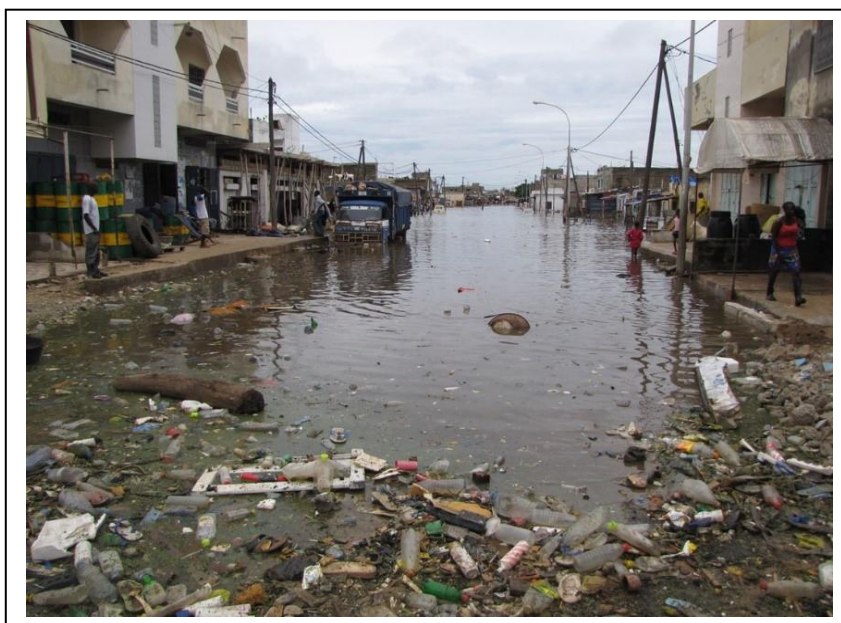
Photo 1 : La route principale inondée (photo de A. Amiguet, 2009 ; utilisée par Chabot et al., 2018)

Le 12 août 2016, une large portion de la route principale séparant la commune de Djiddah Thiaroye Kao de celle de Medina Gounass est inondée, comme c'est très régulièrement le cas en cette période de l'année (photo 1). En préparation de l'arrivée des eaux, une réunion se tient deux mois plus tôt à la mairie de DTK rassemblant des sapeurs-pompiers, des membres de l'Agence de développement municipal, des représentants de la préfecture, certains « acteurs communautaires », ainsi que des membres de la commission municipale « cadre de vie et environnement » qui tente d'assurer les fonctions de la PLCI depuis la dissolution de cette dernière. Durant cette rencontre, ces