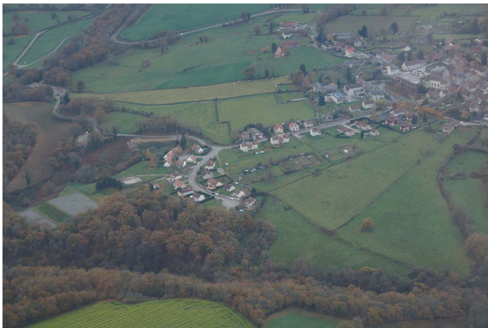
Fig. 1 – Vue aérienne du bourg d'Ahun