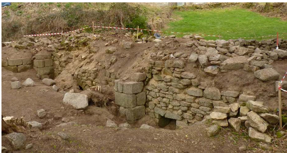
Fig. 1 – Mur gouttereau nord de l'église du prieuré de Montaigut en cours de nettoyage