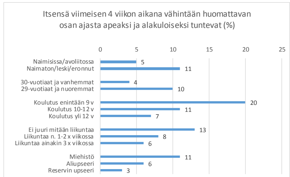
Kuvio 3. Osuus (%) reserviläisistä, jotka ovat tunteneet itsensä viimeisen 4 viikon aikana vähintään huomattavan osan ajasta apeaksi ja alakuloiseksi taustamuuttujien suhteen

Itsensä apeaksi ja alakuloiseksi tunteminen oli yhteydessä alhaisempaan ikään ( p=0,027 ), vähäisempään koulutukseen ( p=0,014 ), naimattomuuteen ( p=0,001 ), vähäiseen liikunnan määrään ( p=0,009 ) sekä alhaisempaan sotilaskoulutukseen ( p=0,018 ) (Kuvio 3).