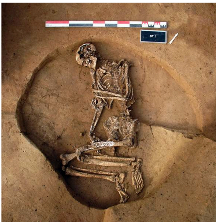
Fig. 3 – Vue générale zénithale de la sépulture de la structure 1