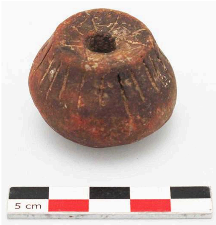
Fig. 1 – Fusaïole décorée biconique, légèrement asymétrique, à carène arrondie