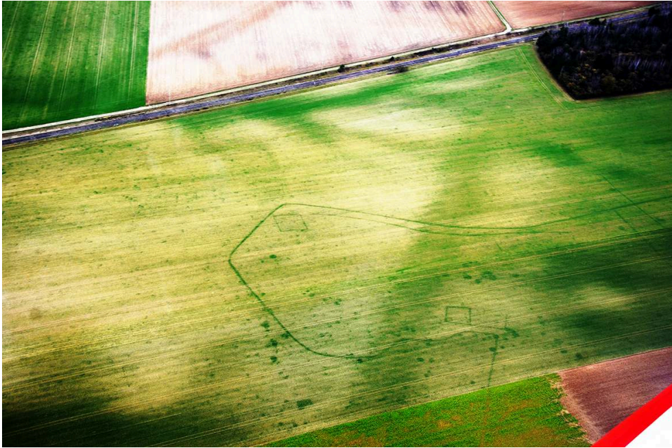
Fig. 2 – La Cheppe, champ des Bœufs : conditions favorables dans le secteur Reims-Châlons-en-Champagne