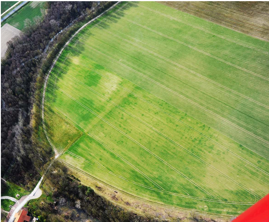
Fig. 6 – La Cheppe, Camp d'Attila : occupation structurée