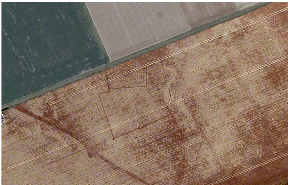
Fig. 1 – Togny-aux-Bœufs, la Garenne : conditions favorables dans le secteur Reims-Châlons-en-Champagne