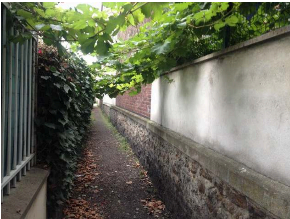
Figure 10. Taffarault, L'Île-Saint-Denis, 2013

tant qu'ils proposent un univers du proche, de la petite échelle (étroitesse qui crée un « micro couloir de vue »), de la maison privée (visibilité de la végétation des jardins, fenêtres et silhouettes des habitants qui vivent là), du détail (plantations, sol avec ses mousses, cailloux, terres). Ils sont associés à des représentations sociales de l'intimité (entre soi dans un espace à l'écart protégé, bien qu'ouvert au passage, où la sphère privée envahit la sphère publique, où « on est obligé de bien s'entendre ». Ils ont une valeur symbolique liée à l'idée de refuge, de nid protégé et imaginaire (« lieu magique », « secret », « ludique »). Ils sont enfin liés aux sensations de calme (« on entend les oiseaux ») et de sentiments paisibles, la sphère privée dominant sur le public.