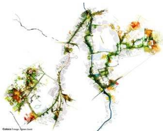
Figure 3. Les délaissés en réseau, Montpellier