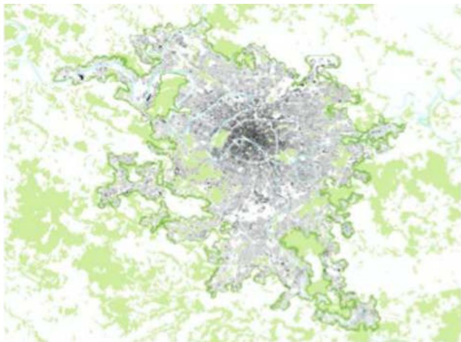
Figure 1. Cartographie des lisières franciliennes