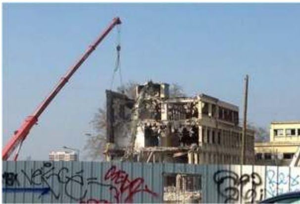
Figure 5. Paysage en mutation exprimant le mouvement urbain, Saint-Denis, 2014