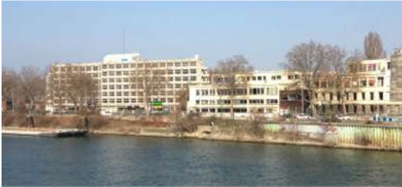
Figure 4. Le 6 B, îlot en friche composé d'un ancien immeuble de bureau et de ses espaces extérieurs entre la Seine et le canal Saint-Denis, Saint-Denis, 2013