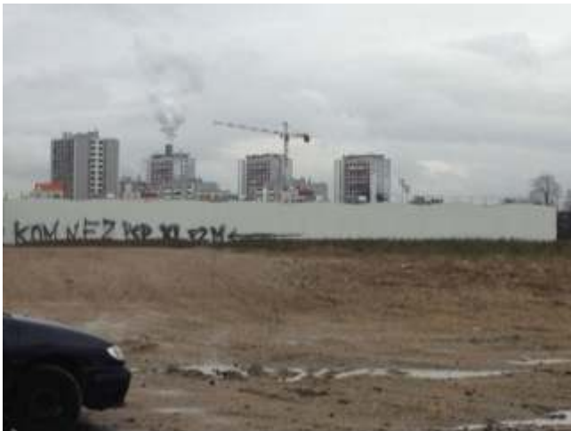
Figure 6. « Les tours qui fument », L'Île Saint-Denis, 2015