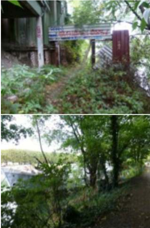
Figures 7. Photos d'habitants des chemins de halage en bord de Seine réalisés dans le cadre des parcours commentés, 2013