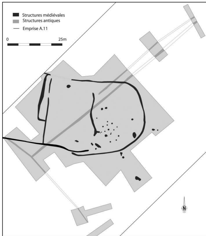
Fig. 1 – Plan des vestiges