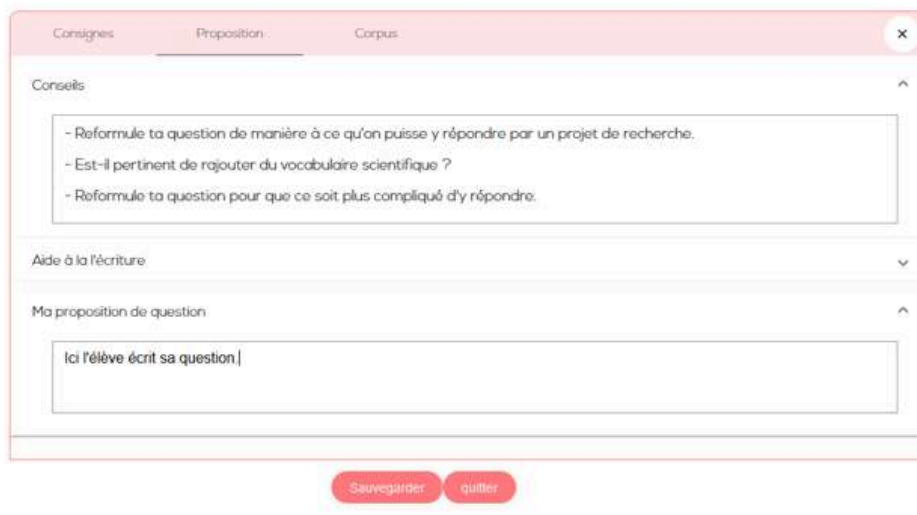
Figure 1 : Capture d'écran d'un des modules du CNEC, le Brouillon de recherche, visant à aider les élèves de l'école primaire et du collège à formuler des questions de recherche.