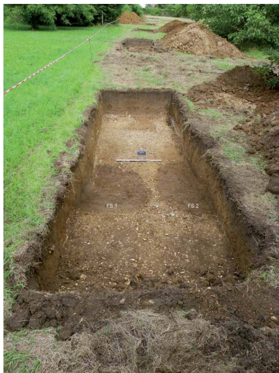
Fig. 2 – Vue du sondage

Au centre, les deux fosses dépotoirs du Bronze final.