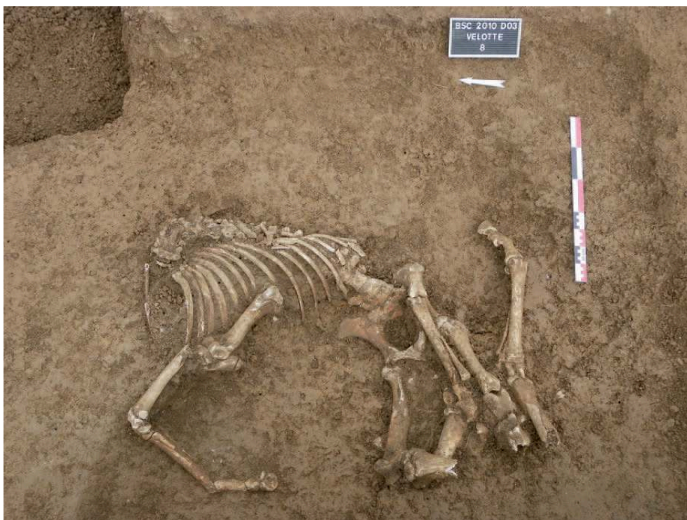
Fig. 3 – Squelette d'un cheval d'époque contemporaine