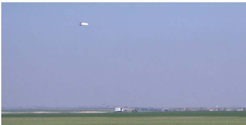
Figure 2. Ballon-sonde blanc hissé au voisinage de Ventville

direction régionale de l'Environnement (DIREN), le SDAP et la direction départementale de l'Équipement (DDE) sillonnent en voiture le territoire concerné par le projet. Il s'agit de traquer les covisibilités du ballon-sonde avec le patrimoine naturel et culturel, ainsi qu'avec les habitations. Cette expérience, qui permet de négocier des ajustements au projet et redonne à l'administration une capacité de maîtrise là où sa gouvernance du paysage était mise en échec, n'est pas portée à la connaissance des riverains.