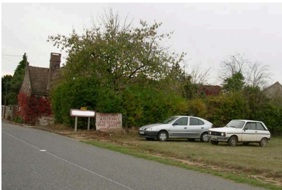
Figure 5. Panneau de protestation contre le projet éolien à l'entrée de Ventville