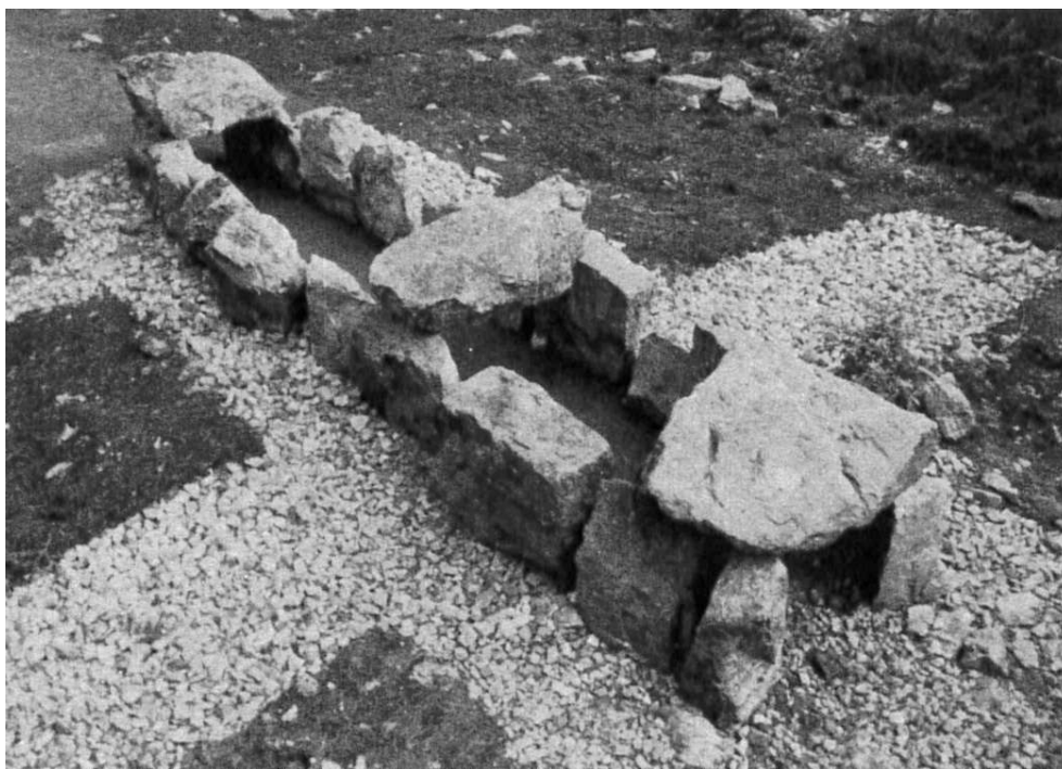
Fig. 2 – Vue générale sur l'allée couverte