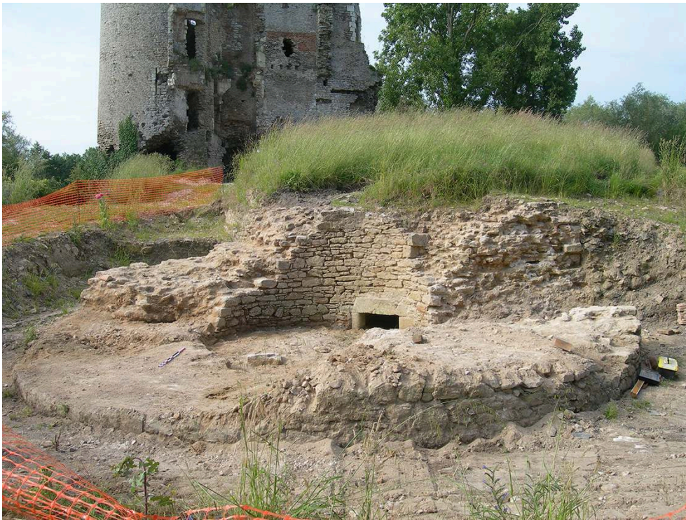
Fig. 2 – Vue de la tour circulaire nord-est avant fouille

On aperçoit, à l'arrière-plan, les principaux vestiges conservés en élévation.