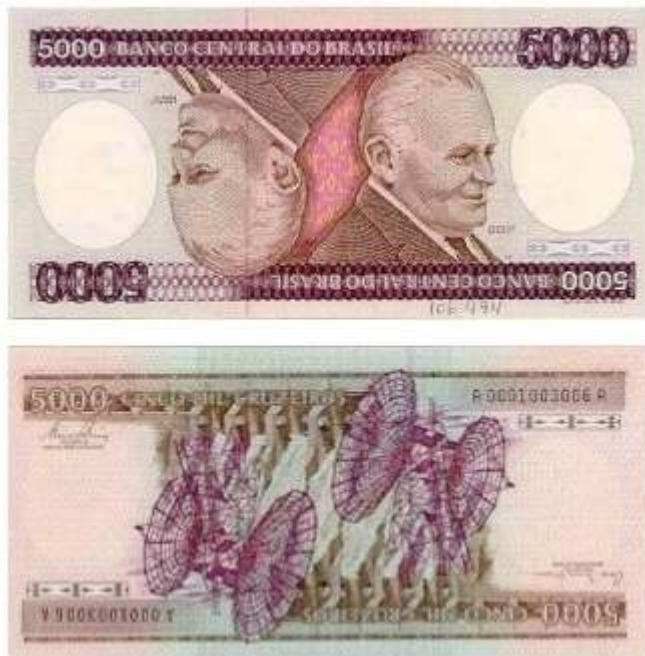
Figura 5 – Cédula de Cinco Mil Cruzeiros, anverso e reverso