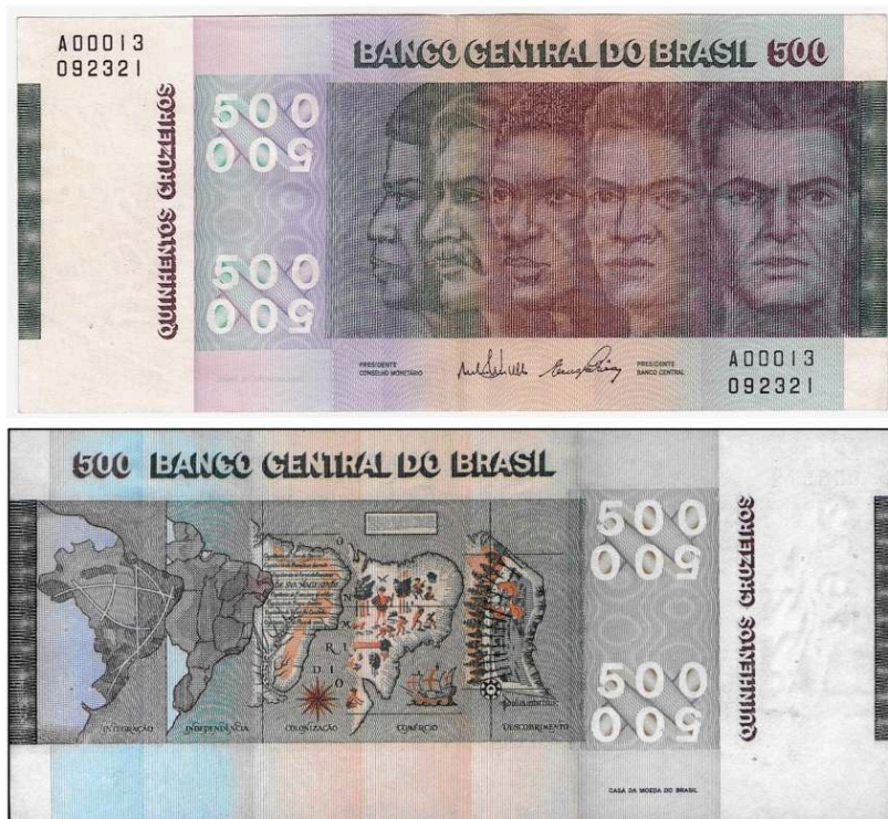
Figura 2. Cédula de Quinhentos Cruzeiros, anverso e reverso