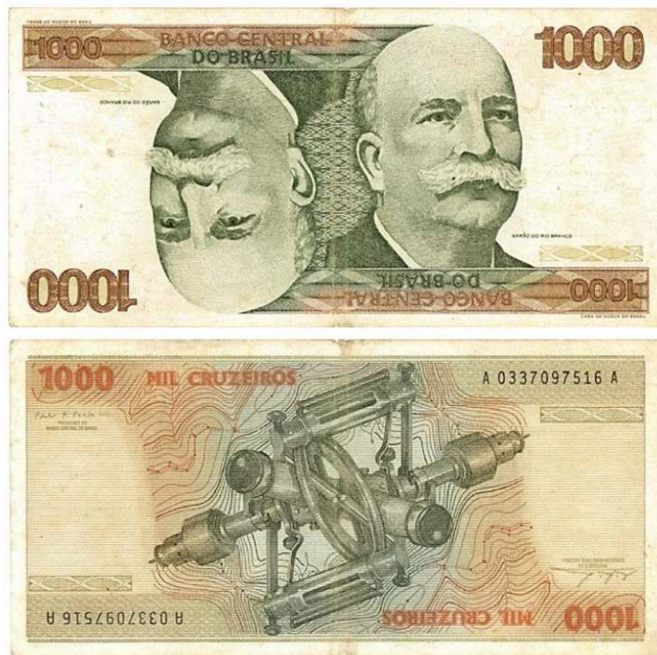
Figura 4 – Cédula de Mil Cruzeiros, anverso e reverso