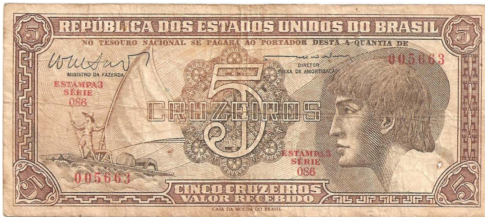
Figura 1. Cédula de Cr$ 5,00 (cinco Cruzeiros) emitida em 1961, conhecida como “cédula do índio”