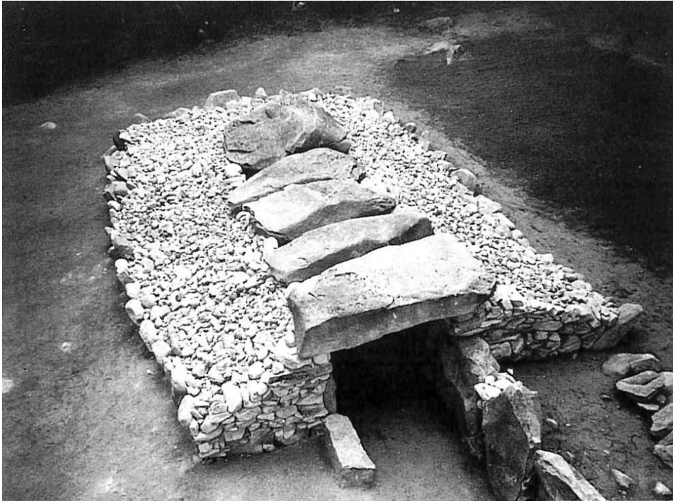
Fig. 1 – Vue de la partie restaurée du monument