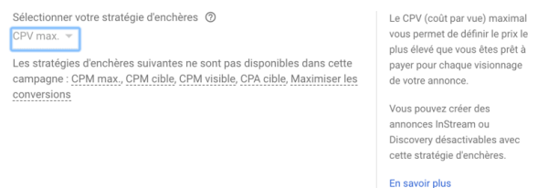
Figure 4. Le compte des vues tel qu'il est sémiotisé dans l'outil Google Ads

Tous ces dispositifs donnent une lisibilité et une intelligibilité aux chiffres de vues, qu'il s'agit chaque fois de réinterpréter différemment, même si, hormis dans AdWords , ils sont toujours reliés à une périodicité donnée, afin de lire une tendance statistique, de surveiller des évolutions et d'en tirer des stratégies.